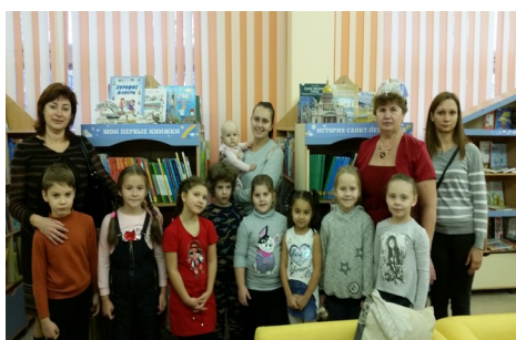
В районной детской библиотеке «Радуга» (2022)