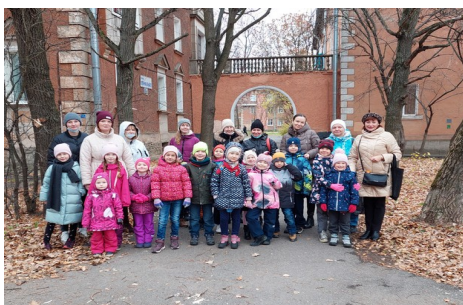
Исторические здания Красносельского района Семейная экскурсия (2022)