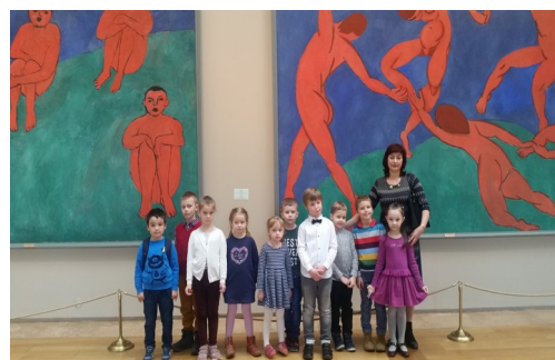
Сказочный Эрмитаж. Цикл экскурсий (2022)

Сообщество группы VK «Детство с Петербургом» https://vk.com/detstvo_s_spb Сообщество группы VK «Студия Гармония ДДТ Красносельского района СПб» https://vk.com/razvitierchiddt